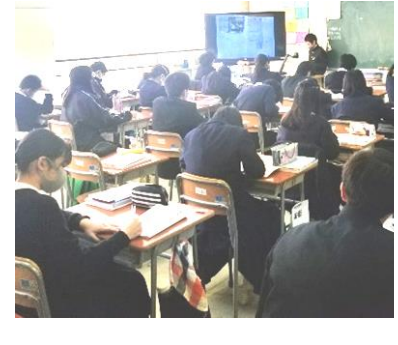
《N I Eノート発表の様子》

公開授業では、社会科授業で行っている「N I Eノート活動」を中心に、さまざまなN I E活動を報告します。トライやる事業では兵庫県N I E推進協議会の事務局による講座から、生徒自身が「取材」「記事作り」などを体験したことを報告します。